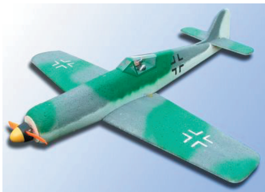
FW-190 D-9 EPP warbird

Spannweite: 850mm Gewicht: 350-450g Tragfläche: verschraubt, daher abnehmbar. Servos: 1 Höhe, 2 Quer Kabinenhaube: Transparent