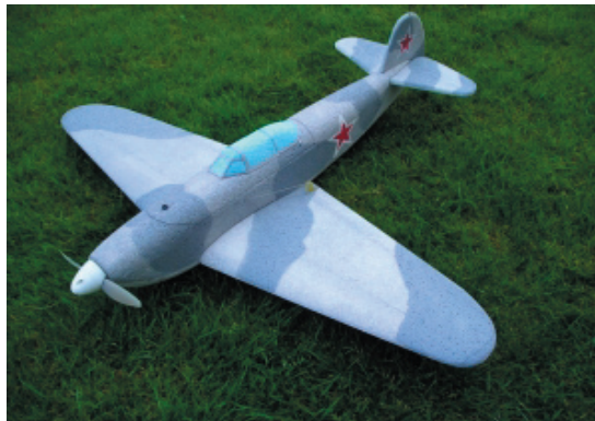
JAK-3 EPP warbird

Spannweite: 850mm Gewicht: 350-450g Funktionen: Höhe, Quer, Motor Kabinenhaube: EPP Servos: 1 oder 2 Quer, 1 Höhe