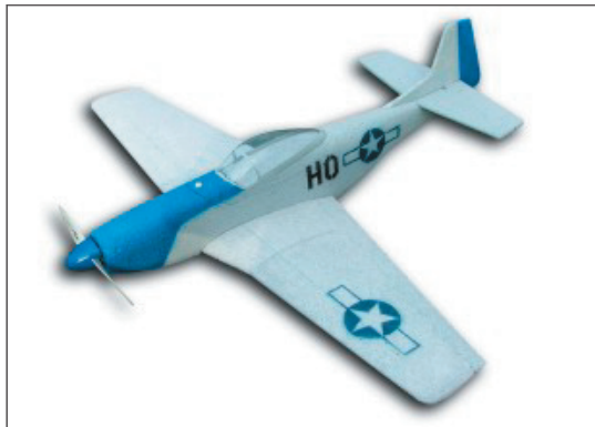
P-51D Mustang EPP warbird

Spannweite: 855mm Gewicht: 300-450g Servos : 1Höhe, 1oder 2 Quer Kabinenhaube: Transparent