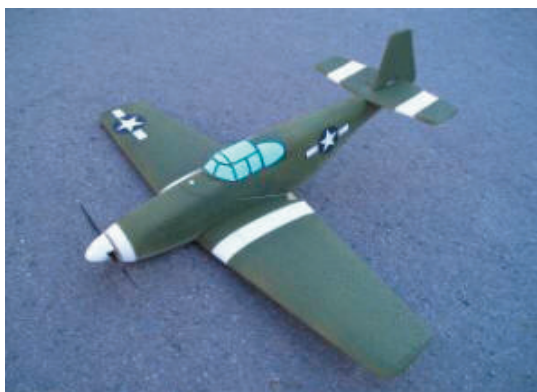
P-51B Mustang EPP warbird

Spannweite: 850mm Gewicht: 350-450g Servos : 1Höhe, 1oder 2 Quer