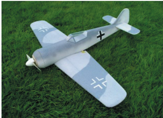
FW-190 A EPP warbird

Spannweite: 850mm Gewicht: 350-450g Servo: 2 Quer, 1 Höhe Tragfläche: verschraubt, daher abnehmbar. Kabinenhaube: Transparent