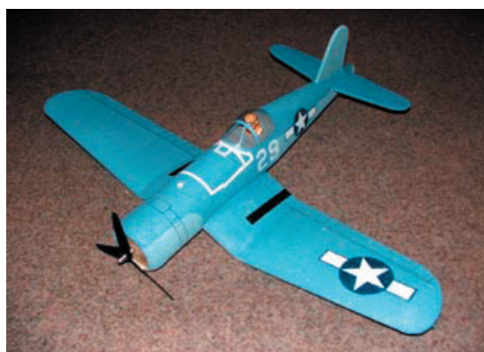
F-4U Corsair EPP warbird

Spannweite: 850mm Gewicht: 350-450g Tragfläche: verschraubt, daher abnehmbar. Alternativ verklebt mit Rumpfausschnitt Kabinenhaube: Transparent Servos: 2 Quer zwingend, 1 Höhe